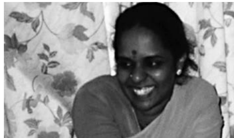
НА ФОТО: МЭРИ ДЖОЙС ПУНАЧА

После прибытия в Бангалор и размещения в отеле разведчик задумался: а что дальше? Часть плана была им успешно реализована, но как ему выйти на Святослава Рериха? Ответа на этот вопрос у него пока не было. Поэтому для начала он решил пройтись по округе и осмотреться.