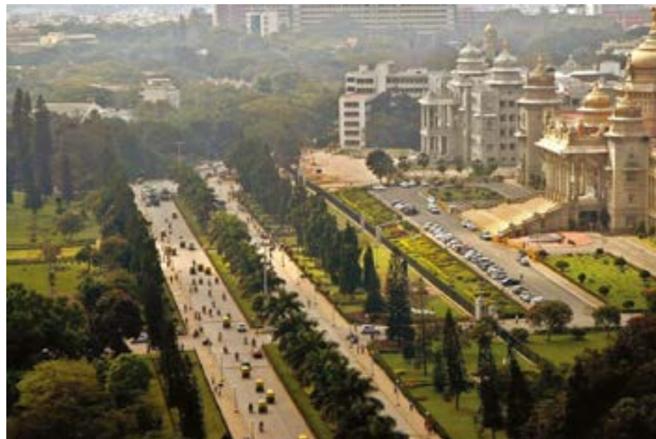
НА ФОТО ГОРОД БАНГАЛОР