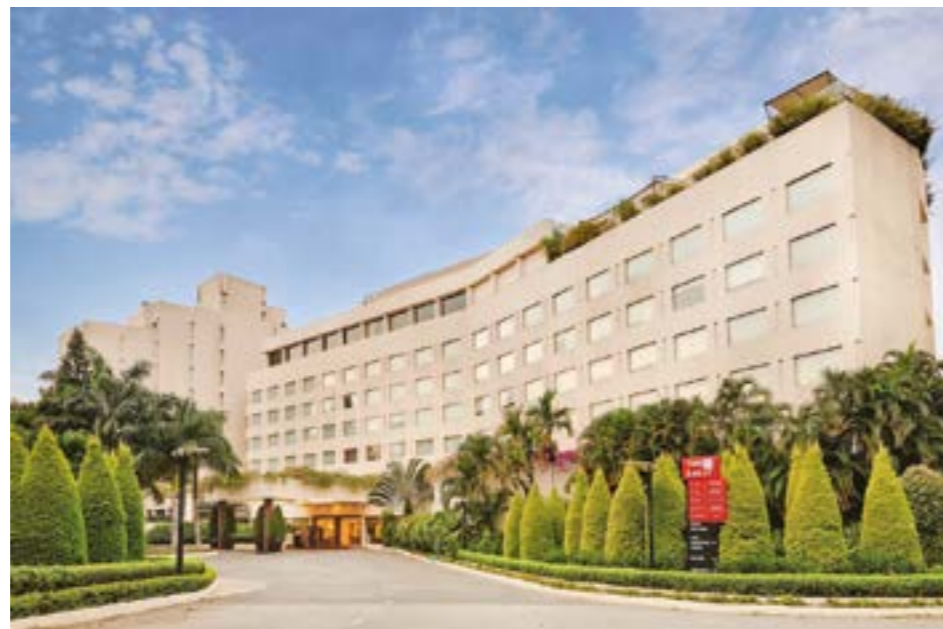
НА ФОТО: БАНГАЛОР ОТЕЛЬ «АШОКА»

В салон авиалайнера вошел человек, что-то