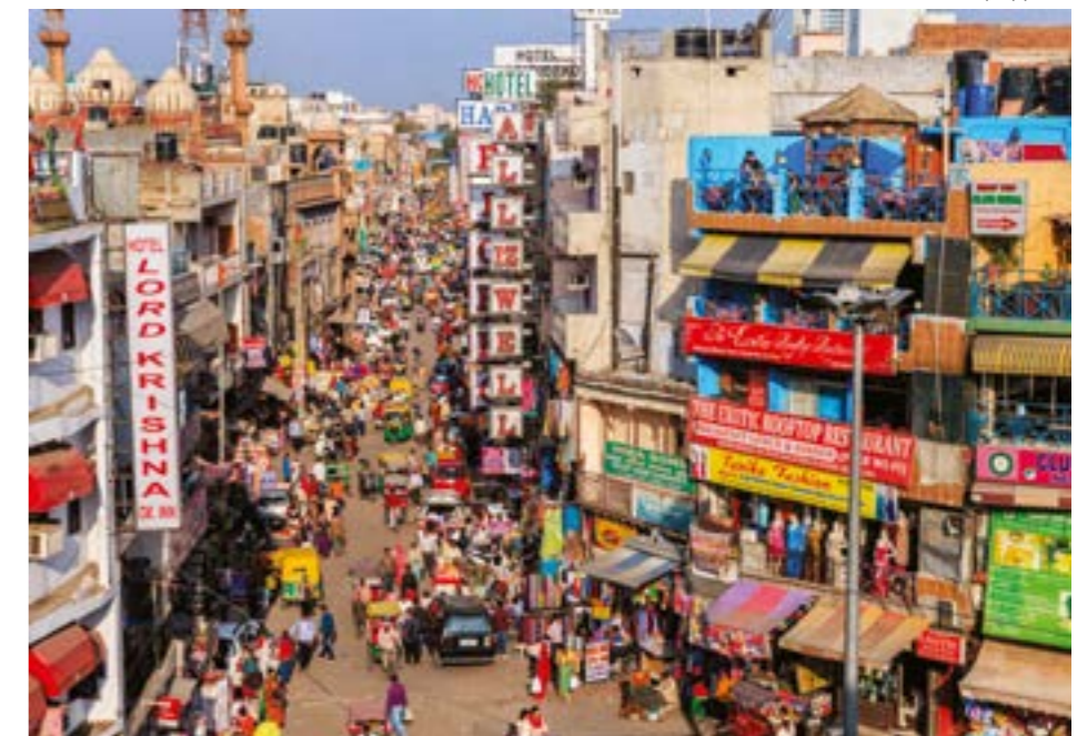
НА ФОТО: УЛИЦЫ ДЕЛИ

– Я не буду это читать, – отрицательно покачал я головой. – Это не мне предназначено.